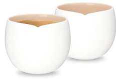
Set da 2 Origin Collec...